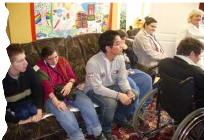
Вместе с друзьями из Гамбурга

Показ спектакля в Петербурге стал не только серьезным событием августа 2008 года, но и серьезным событием всех восьми лет работы театральной студии в интернате. Наши актеры в первый раз играли на публике полнометражный спектакль на малых сценах известных в городе театров: в Театре Юных Зрителей им. А.А.Брянцева, в театре-фестивале «Балтийский Дом», также спектакль был показан в клубе «Этаж». И имели настоящий успех! Каждый раз зрителей было настолько много, что едва хватало мест всем желающим.