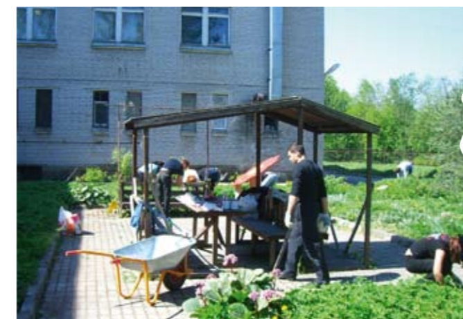
Беседка 4-го корпуса