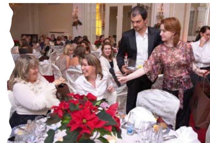
Вечер в Астории

В результате все 100% собранных средств, а это 602 тыс. рублей, пошли на наши программы помощи в ПНИ №3.