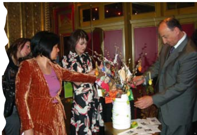
Благотворительная акция в «Madam Grand»