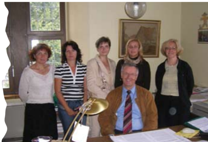
В школе «Под радугой»

В апреле 2008 года директор и группа педагогов интегративной школы «Под радугой» г. Нихайма (Германия) приехали в Петербург для ознакомления с опытом и профессиональными трудностями педагогов классов «Школы для каждого» в 25-й коррекционной