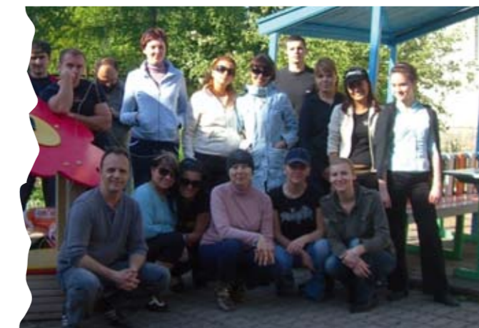
Сотрудники «Madam Grand» в ДДИ