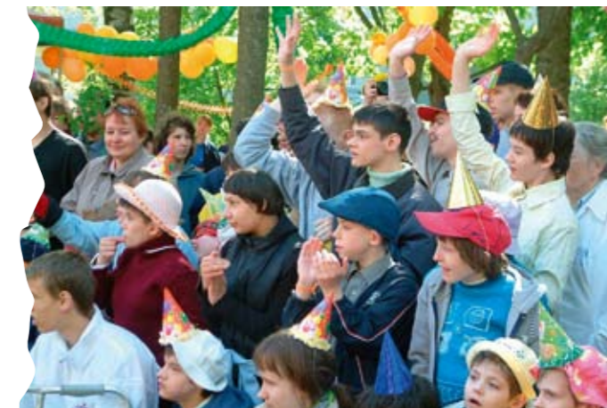
На празднике 31 мая

После этого для ребят было подготовлено увлекательное путешествие по станциям, каждая из которых была посвящена своей тематике. Кто-то с увле-