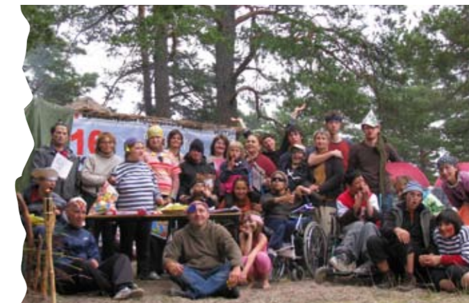
Летний лагерь в Окуневской бухте

В конце смены по традиции волонтеры вместе с ребятами провели праздник под названием «Морские жители Окуневой бухты». С самого утра, после завтрака, каждый ребенок с помощью волонтера придумал и сделал себе костюм. На празднике были и русалки, и акулы, и водяные, и даже пираты. После интерес-